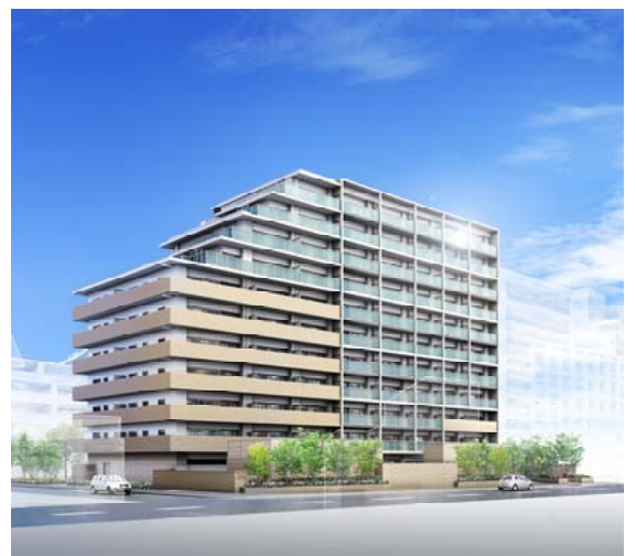
プライムメイツ アスタ 完成予想図