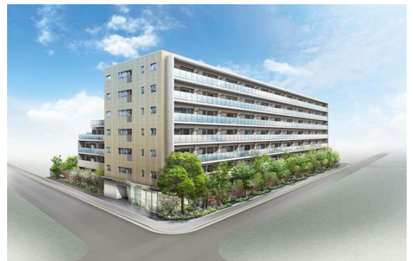
メイツ ABIKO リュクシス 完成予想図