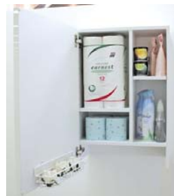
スポットロール写真

「トイレの収納は小さくて使いにくい」という主婦の声にお応えして、12ロールのトイレットペーパーを買ってきたまま仕舞えるように仕切りを工夫したオリジナルのトイレ収納です。 可動棚で、トイレ洗剤などのボトル類も収納できます。