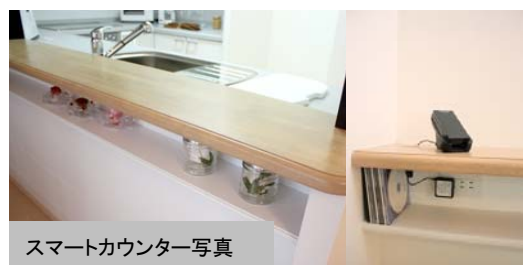
スマートカウンター写真

「リビングをおしゃれに演出したい」「キッチンカウンターの上に散乱する家族の充電中の携帯電話をなんとかしたい」という声にお応えして、対面カウンター下に棚を設置しました。棚には、3口コンセントを設置しているので、携帯電話やデジタルカメラの充電スペースとしても重宝します。