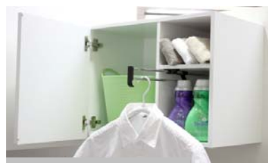
スロットランドリー写真

「洗濯機横に棚を置くスペースがない」「洗濯機の上の空間を収納に利用したい」という声にお応えして、洗濯機置場上部のスペースを有効活用するために、吊戸収納を設置しました。洗濯洗剤やタオルの収納に、また、ハンガーパイプ付で、仮干しにも便利です。洗濯物の一時保管も重宝します。